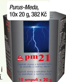
Purus-Meda, 10x 20 g, 382 Kč

Cítíte se vyčerpaní, bez energie? Zkuste pitné ampule PM 21. Obsahují šťávu z ovoce Noni, extrakty damiany, adaptogenu maralu, ženšenu, révy vinné, mateří kašičky a dalších bylin. Účinné látky podporují normální činnost mozku a nervové soustavy i racionální řešení stresových situací.