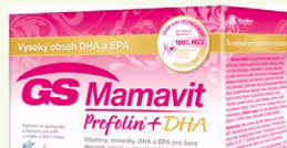
Green-Swan Pharmaceuticals, 30 tablet+30 kapslí, 481 Kč

Doplňek stravy GS Mamavit Prefolin+DHA obsahuje 23 vitamínů a minerálů důležitých pro maminky a jejich miminka v průběhu těhotenství i během kojení. Přípravek byl vyvinut ve spolupráci s odborníky z Ústavu pro péči o matku a dítě v Praze.