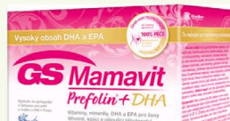
Green-Swan Pharmaceuticals, 30 tablet+30 kapslí, 481 Kč

Doplňek stravy GS Mamavit Prefolin+DHA obsahuje 23 vitamínů a minerálů důležitých pro maminky a jejich miminka v průběhu těhotenství i během kojení. Přípravek byl vyvinut ve spolupráci s odborníky z Ústavu pro péči o matku a dítě v Praze.