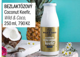
BEZLAKTÓZOVÝ Coconut Keefir, Wild & Coco, 250 ml, 790 Kč