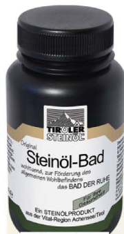
PŘÍRODNÍ Steinöl-bad, 250 ml, 390 Kč