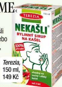
Terezia, 150 ml, 149 Kč

Zdravotnický prostředek Nekašli vám uleví, ať už máte suchý nebo vlhký kašel. Extrakty z jitrocele, šípku, máty, lipového květu, mateřídoušky a smrku navíc pomáhají zmírnit bolest v krku a chrapot.