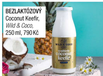
BEZLAKTÓZOVÝ Coconut Keefir, Wild & Coco, 250 ml, 790 Kč